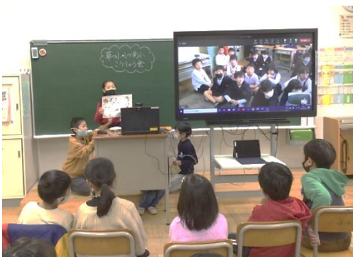
【草津小学校とオンライン交流】