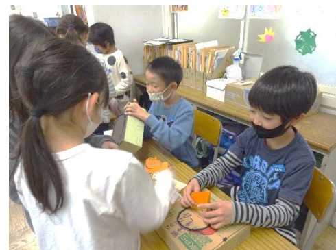
【4年生との交流学習】