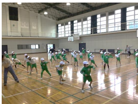
【立命館大学ダンスサークル】