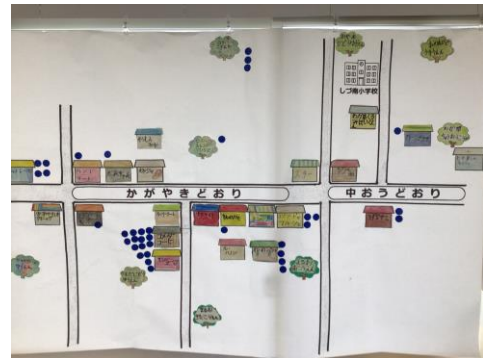
生活科「お気に入りのばしょをしようかいしよう」