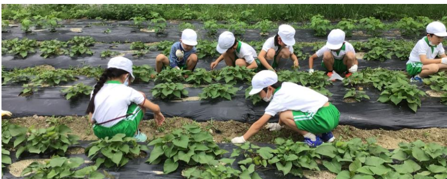
さつまいも畑の草取りもがんばりました！