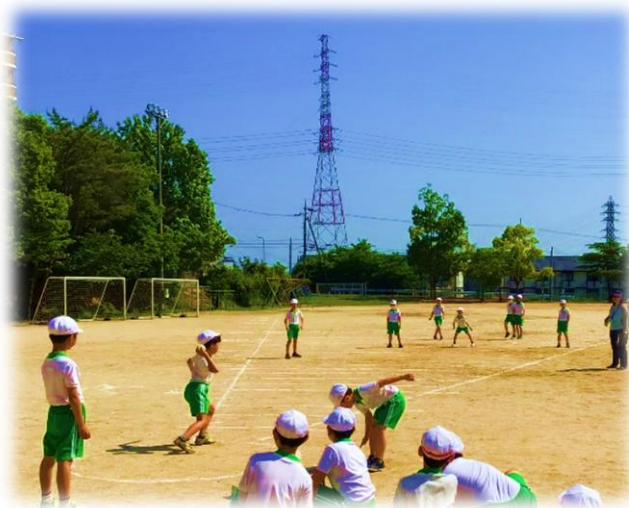
【ソフトボール投げ】