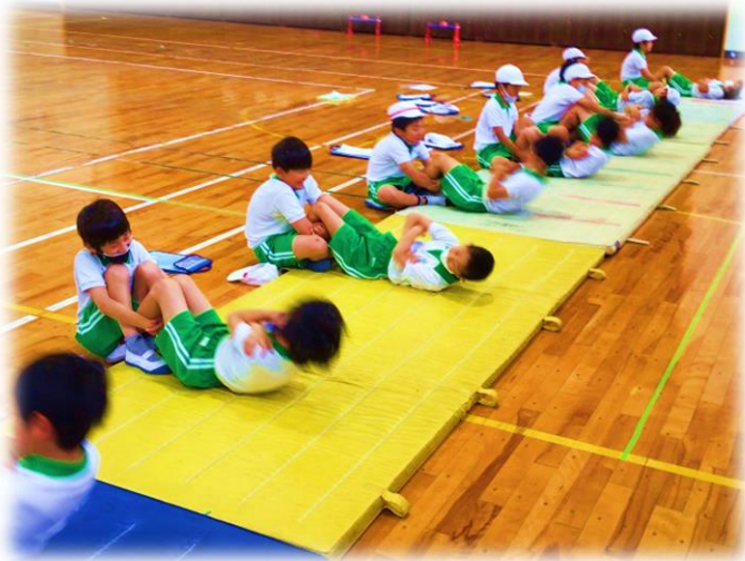
しょうたい お 【上体起こし】

16日（火）に、新体カテスト がありました。暑い日でした が、一人ひとりが目標を持って がんばって取り組みました。