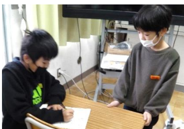
【 4年生との交流学習 】