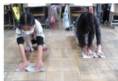
【 全校ぴかぴか週間 】

学年通信は、志津南小学校ホームページ ( http://www.shizuminami-p.skcd.ed.jp/ ) でもご覧いただけます。