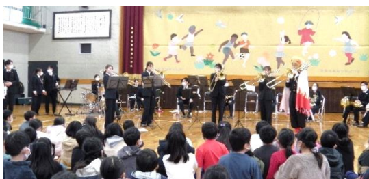
【 立命館大学吹奏楽部の演奏 】